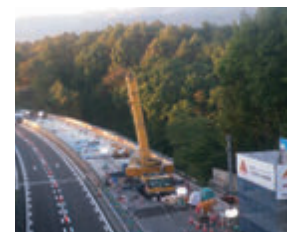
床版取替工事 全景