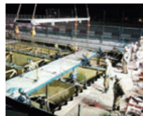
新しい床版の設置