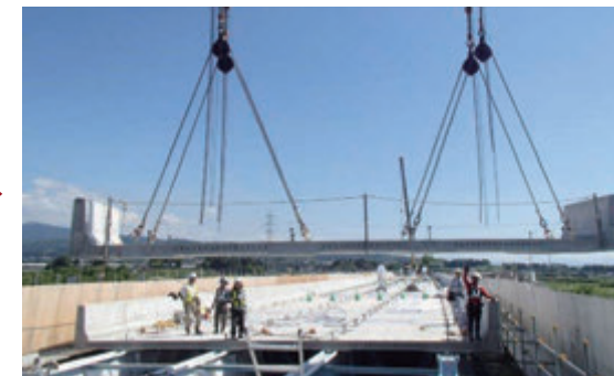
プレキャストコンクリート床版の施工状況