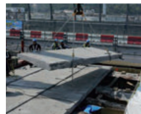
老朽化した床版の撤去