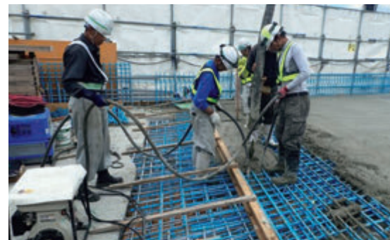
現場打ち床版の施工状況

新たに設置する床版には工場で作成したコンクリート製品を採用することで、 速やかな工事をおこないます。