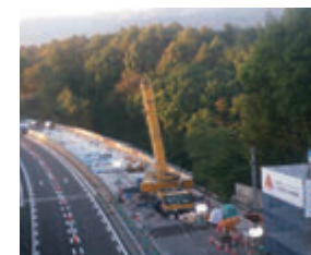
床版取替工事 全景