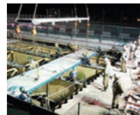
新しい床版の設置