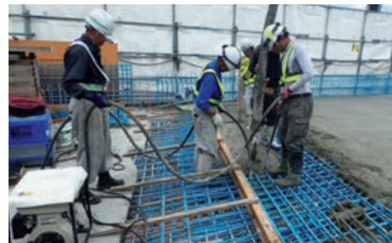
現場打ち床版の施工状況

新たに設置する床版には工場で作成したコンクリート製品を採用することで、 速やかな工事をおこないます。